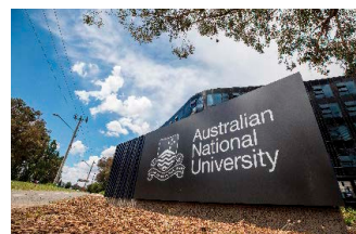
オーストラリア国立大学

国際関係学部開設以来の立命館大学の国際化は驚異的なものです。立命館大学の学生が世界中の大学に留学しているのと同時に、世界中から来日した留学生が立命館大学で学んでいます。立命館大学は、地域社会、日本社会、そしてグローバル社会によって生かされているといえます。そして立命館大学は、さまざまな連携の中で不断に成長し続けているのです。