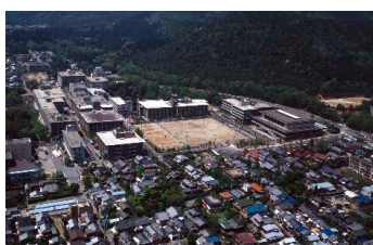
衣笠一拠点直後の衣笠キャンパス