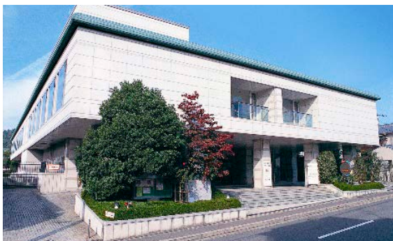
国際平和ミュージアム