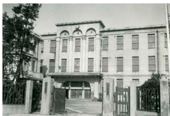
広小路キャンパス

立命館大学のキャンパスはもともと広小路キャンパス（現在の京都府立医科大学附属図書館のあたり）を中心として、