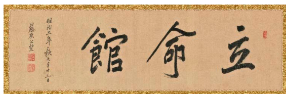
扁額『立命館』 1869(明治2)年

1869(明治2)年9月、西園寺公望は京都御苑にあった自分の屋敷に、新しい時代を担う若者を育てるための私塾「立命館」を開設しました。「立命館」の名は、孟子の『尽心章句』に由来し、「学問を通じて自らの人生を切り拓く修養の場」を意味します。ここでは富岡鉄斎(1837～1924) 2) や江馬天江(1825～1901) 3) など、一流の漢学者や画家などが教師として参画しました。私塾「立命館」は、公家だけにとどまらない教育機関だったようです。しかし、開塾してわずか6カ月、塾で活発に議論する若者たちを不穏動きとみた京都府は、廃校の命令を出したのです。そのとき、遠く長崎にいた西園寺は、ヨーロッパへの留学を準備していたため、なすすべがありませんでした。