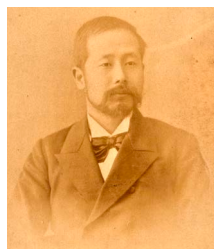
中川小十郎 1897(明治30)年 文部省参事官時代

第一高等中学校(大学予備門)を経て中川は、帝国大学法科大学(現・東京大学法学部)法律学科へ入学(翌年に政治学科へ転籍)進学しました。大学予備門時代には、山田美妙(山田武太郎)、正岡子規(正岡常規)や南方熊楠らと同窓でした。夏目漱石(塩原金之助)とは特に親しく、漱石の談話速記『落第』 6) には中川との交流が描かれています。中川は、交流のあった西園寺を訪問しました。卒業後、文部省官吏として勤務した中川は、西園寺が文部大臣に就任するとその秘書官に抜擢されました。