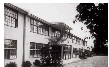
日滿高等工科大学 1939（昭和14）年頃

高等工科大学は当初、工業専門学校に準じる工業学校として開校しました。しかし、1932（昭和7）年に建国された「満洲国」が技術者養成機関を必要としている状況に応じて、高等工科大学を拡充した「立命館日滿高等工科大学」が、1939（昭和14）に等持院の北側に開校します。機械工学科・自動車工学科・航空発動機科・電気工学科・応用化学科・採鉱冶金学科・建設工学科の7学科が置かれ、研究も兼ねた日本刀鍛錬所も併設されました。現在の衣笠キャンパス、そして1994（平成6）年まで同地にあった理工学部の歴史は、当時の国際的な状況のなかで展開していたのです。