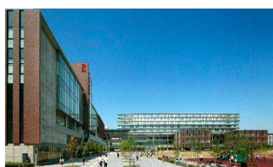
大阪いばらき キャンパス (OIC)

1994年に開設されたBKCには、その後1998年に経済学部と経営学部が衣笠キャンパスから移転して、近江商人の伝統のある地で経済学・経営学を展開しました。また、1987年に設置された理工学部情報工学科は、2004年に理工学部から独立して情報理工学部となりました。これは立命館の9番目の学部で、日本最大級の情報系学部です。衣