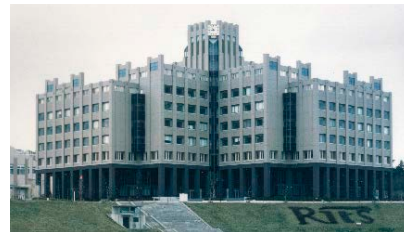
びわこ・くさつキャンパス (BKC)