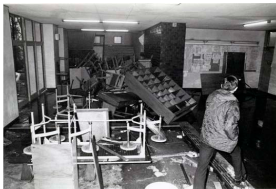
広小路キャンパス恒心館封鎖解除後。 散乱する事務所の机、いす等

1960年代に日本の大学は大きく変化しました。立命館大学も例外ではありません。1965-67年前後に、1947-49年生まれの第1次ベビーブーム世代＝団塊の世代が大学に入学しました。この世代は人口が多いことに加えて、日本の高度経済成長もあり、大学進学率も上昇しました。この世代から大学受験競争を経験するようになりました。大学は少数エリートのものから広汎な大衆のものへと変化しました。立命館大学の学生数は、1951年の9,465名から1969年の22,407名へ急増し、教学改善のため1963年までほぼ2年に1度の学費値上げを繰り返しました。しかし受験競争を経て入学した大学では、大教室に大人数の学生を詰め込んで、教員が学生に一方的に講義をする授業が多く、学生と教員との対話・知的交流は乏しいものでした。学生は大学に失望し、孤立感・疎外感を深めました。このような背景のもとで、日本各地の大学で大学紛争が起きました。立命館大学の場合、教職員のみならず学生も大学運営のパートとして位置づける全学協議会の制度（後述）があり、学生の立場・主張を尊重する大学運営をしていましたが、それでもなお大学紛争を経験しました。