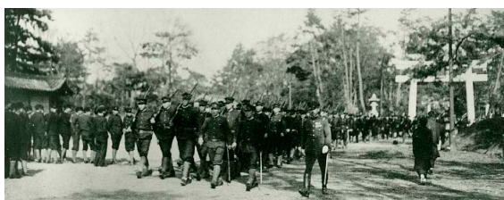
立命館大学生学徒出陣 1943（昭和18）年

1943（昭和18）年に大学生の徴兵猶予を廃止したいわゆる学徒出陣によって、3,149人もの立命館の学生が戦地に送られ、89人（百年史編纂室調査）の尊い命が失われました。当時の国策とはいえ、立命館が教育機関としてそれに同調した事実は、深く反省するとともに、永久に記憶に留めねばなりません。なお立命館大学は、徴兵に志願しなかったために学園を除名された33名（百年史編纂室調査）の朝鮮・台湾出身学生の除名処分の取り消しと、特別卒業証書の授与と名誉回復を行ないました。そして、1996（平成8）年3月、所在が明らかになった韓国籍9名と台湾籍1名の元学生に対して、特別卒業証書を授与しました。