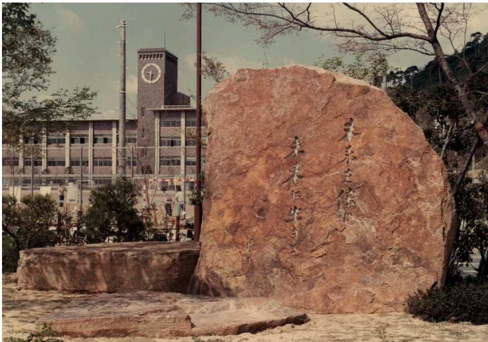
「未来を信じ未来に生きる」の石碑 1981(昭和56)年

立命館憲章は、大学・学園が組織として形式的に定めているだけでなく、学生の皆さんを含む大学・学園の構成員一人一人が理解し、共有すべきものであると私たち教職員は考えています。本章での解説が、立命館大学はどのようにして現在に至っているのか、これまで何を大切にしてきたか（またいま大切にしているのか）、これから何をめざそうとしているのかを皆さんが理解する一助となれば幸いです。