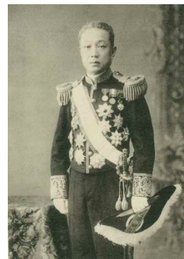
西園寺公望 1906(明治39)年 第1次西園寺内閣時代

ここで少しだけ時計の針を戻しましょう。1894(明治27)年、文部大臣に就任した西園寺公望は、当時文部省の官僚だった中川小十郎(1866～1944)を秘書官に抜擢し、京都帝国大学(現・京都大学)の創設を担当させました。それでは、