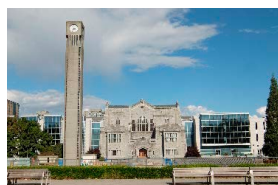
ブリティッシュ・コロンビア大学

前述したように、2015年に大阪いばらきキャンパス（OIC）が開設されましたが、政策科学部が衣笠から、経営学部がBKCからOICに移転しました。翌2016年には、文学部心理学専攻の発展・独立として総合心理学部が14番目の学部としてOICに新設されました。さらに2024年度には映像学部と情報理工学部がOICに移転し、新たな教学展開を目指します。また、経営学部が移ったあとのBKCには、2018年、15番目の学部として食マネジメント学部が設置されました。2019年にはOICに、グローバル教養学部が16番目の学部として新設されました。