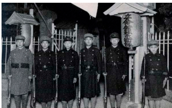
立命館禁衛隊（1939（昭和14）年卒業アルバムより）

当時、日本の植民地地域であった朝鮮出身者も立命館大学で学んでいました。彼らの多くは、一度就職して社会体験を積んだあと高度な学問、特に法学を学んで社会的にステップアップするために入学しました。卒業後の進路をみると、京都市や大阪市などの行政機関への就職が確認できます。ただし、これらは少数に留まり、過半数は民間企業、とりわけ京都市の伝統的な繊維産業への就業でした。一方、祖国に戻って朝鮮総督府、ならびに朝鮮平壤放送局、朝鮮放送局や東亜日報などの大手マスコミでの活躍も特筆されます。