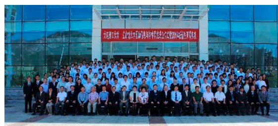
国際情報ソフトウェア学部の新入生と関係者の集合写真