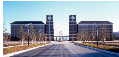
立命館アジア太平洋大学 (APU)

理工学部が衣笠キャンパスにありました。広小路キャンパスにあった文社系学部は1965年から徐々に衣笠キャンパスに移転し、法学部が1981年に移転したことで立命館大学は衣笠キャンパス一拠点となりました。この時点で、立命館大学は法学部、経済学部、経営学部、文学部、産業社会学部、理工学部の6学部で構成されていました。大学が、社会の人材育成ニーズや研究ニーズに応じて、研究教育の深化・高度化・新展開を追求していくと、それが既存学部の拡充や新しい学部の設置をもたらすことがめずらしくありません。そして、それは新キャンパスの創造を必要とします。衣笠キャンパス一拠点化の後の立命館大学の展開はまさにそのようなものとなりました。