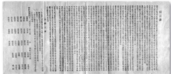
咸鏡道の三一運動で配布された「独立宣言書」(1919年、45.4×20.3)