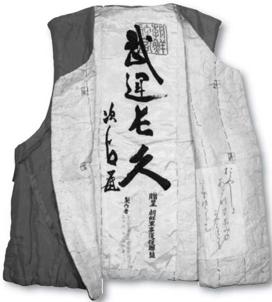
朝鮮軍事後援連盟贈呈の「武運長久」チョッキ

立命館大学は、「韓国併合」100年の年に、立命館創始140周年、学園創立110周年を迎えました。このような節目の年に、本展示が、過去の100年間の日本がアジアにおいて犯した侵略と植民地支配の歴史を正面から見据えて、この歴史の教訓を次世代に伝え、現在まで続く植民地問題をともに考える機会となれば幸いです。