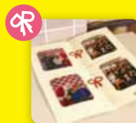
第3回 プロモーション部門最優秀賞 Ribbon キャンペーン

2010年12月に開催された「SPORTS STADIUM」にて参加者の写真をオリジナル写真タテにてセットし、プレゼントしました。また、ステッカーも配布しました。