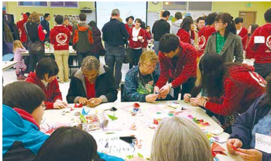
生命科学部独自海外留学プログラム（UC Davis）で学生が企画したWelcome Partyの様子

これらの取り組みを今後さらに発展させることにより、グローバルに活躍できる人材の育成に努めていきます。