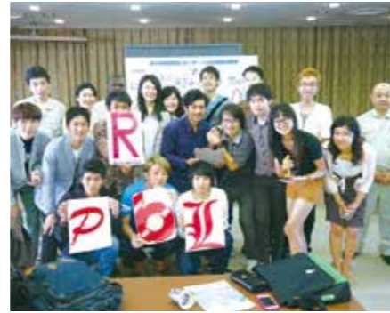
国内学生と国際学生の共同調査(茨木市環境衛生センター)

研究プロジェクト)をも開講しています。「英語で学ぶ」という新しいコンセプトでEPS(English for Policy Science)科目を新設しました。インプットとアウトプットおよび授業中の使用言語により3タイプに分かれるこれらの科目では、大学入学までに身につけた英語力を基礎とし、それをさらに伸ばしつつ、大学で得た専門的な知識技能をグローバルに活用することを目指しています。(表1)