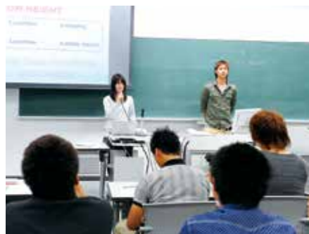
「英語P」での発表の様子