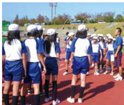
「サービラーニング」での草津市教育委員会主催の体育大会

本学部では、講義で得た理論を様々な実践を通してより深く身に付けるために、スポーツ関連企業、病院、教育委員会等、地域や企業と連携し、インターンシップ、サービラーニングによる学外実習を設定しています。このような実践的な取り組みを通して、リーダーシップとコーチングの力量形成や「社会人基礎力」の獲得を可能にしています。