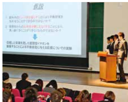
「基礎演習」にて開催される「ゼミナール大会」

から4回生まで配置した小集団科目では、社会人基礎力の系統的獲得を意図し、シラバスに具体化しています。また、キャリア形成科目(スポーツ健康科学セミナー)を通して、本学部での学びと社会貢献とのつながりの深い理解や、スポーツ健康科学検定による能力確認を促したりしています。