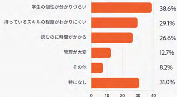
履歴書・エントリーシートに感じる課題 (n=158)

Q 貴社の選考において、学生から提出する履歴書やエントリーシートについて課題を感じていることはありますか？ (MA)